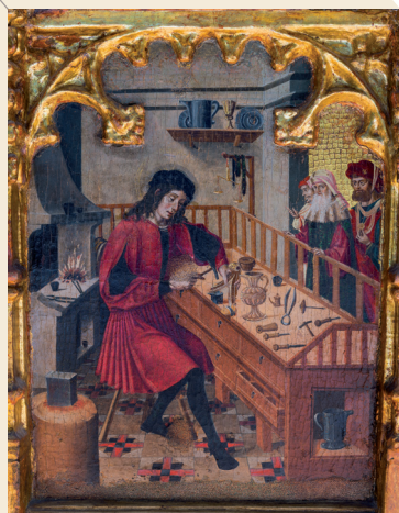
Secondo riquadro della predella