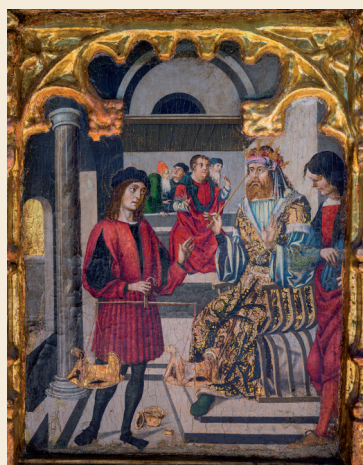
Terzo riquadro della predella