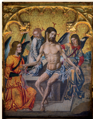
Quarto riquadro della predella