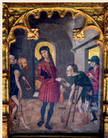
Quinto riquadro della predella