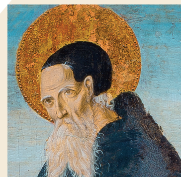
Dettagli dei riquadri inseriti nei polvaroli

Il Retablo di Sant'Eligio (446 cm x 357 cm) è stato esposto nella Chiesa di San Pietro in Sanluri sino al 1913. L'opera è attualmente custodita presso la Pinacoteca Nazionale di Cagliari, all'interno della Cittadella dei Musei in Piazza Arsenale.